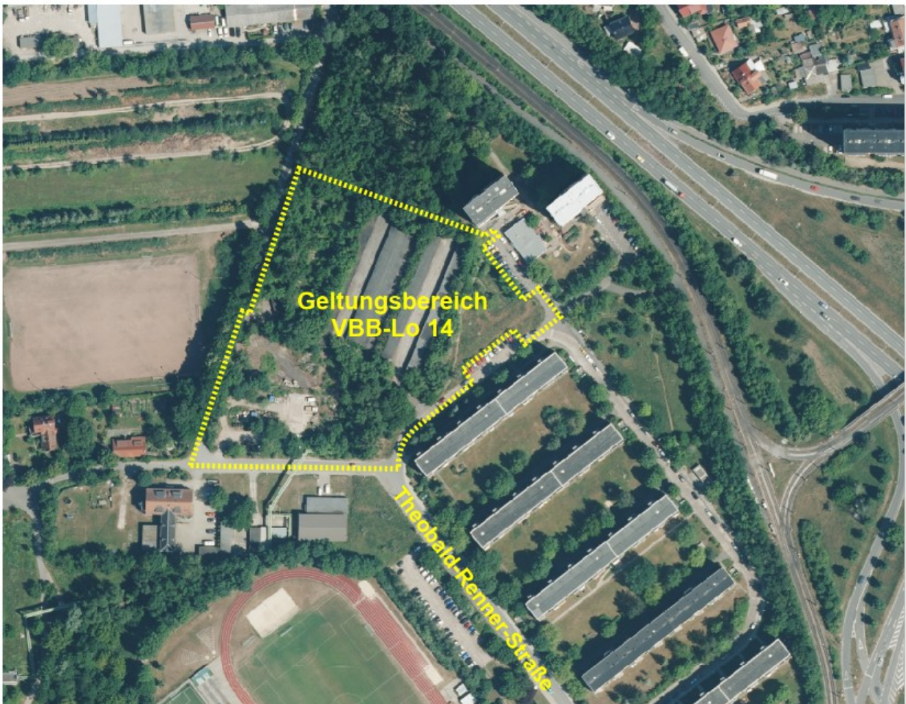
Abbildung 1: Eingenordetes und unmaßstäbliches Luftbild mit Geltungsbereich des vorhabenbezogenen Bebauungsplanes

Das Plangebiet befindet sich im Ortsteil Neulobeda zwischen mehreren Ästen der Theobald-Renner-Straße, unmittelbar nordwestlich der vorhandenen Wohnbebauung. Der Geltungsbereich des Plangebietes ist im beigefügten Übersichtsplan (Abbildung 1) dargestellt.