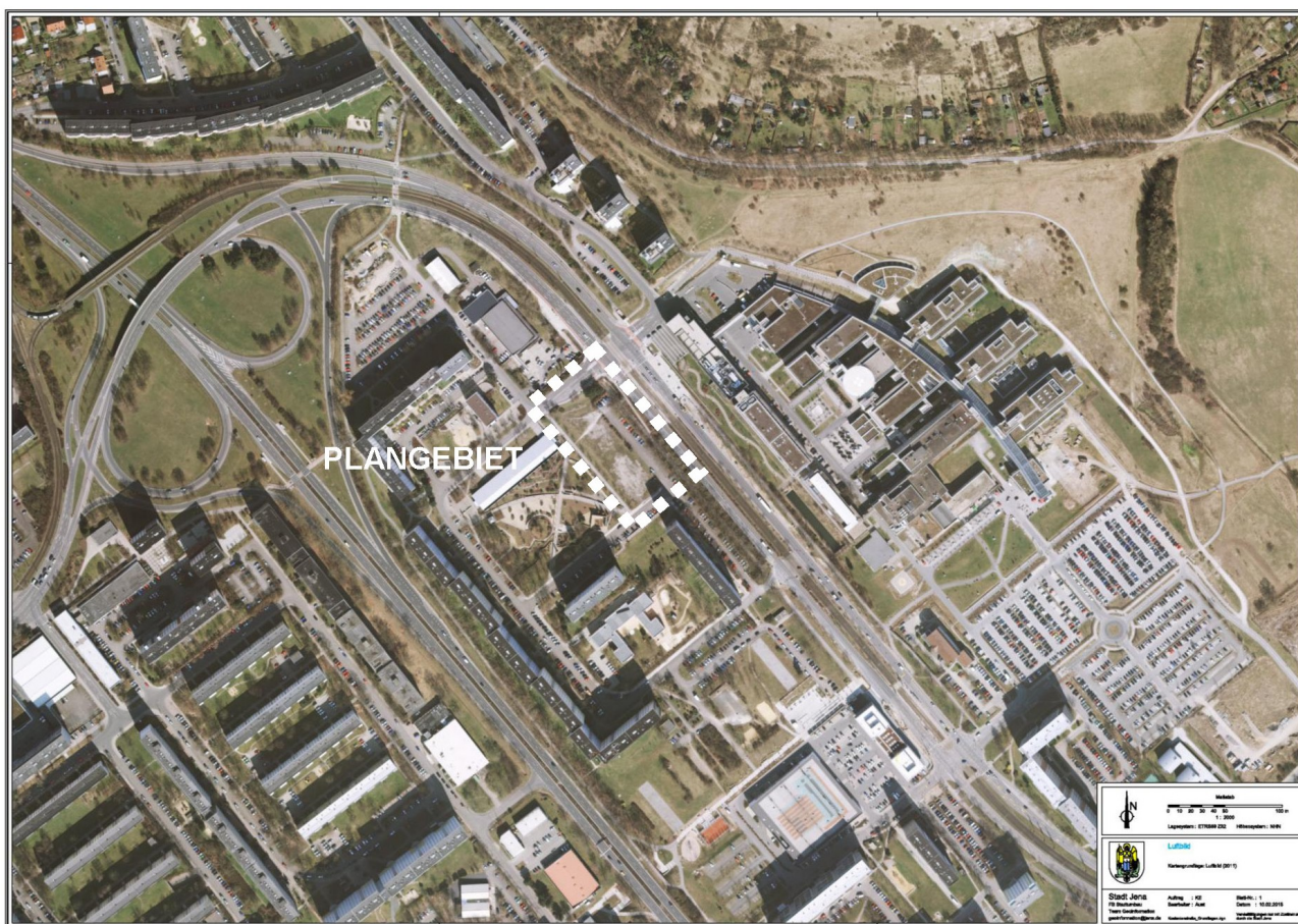
Bebauungsplan der Innenentwicklung B-Lo 08 „Kastanienstraße“ – Luftbild Räumliche Einordnung des Plangebietes

Die Satzung des o.g. Bebauungsplans besteht aus der Planzeichnung und dem Textteil, jeweils datiert vom 26.08.2016. Ihr Geltungsbereich erstreckt sich auf die nachfolgend aufgeführten und im Luftbild markierten Flurstücke der Gemarkung Lobeda, Flur 3: 326/4, 326/5 (teilweise), 332/1, 333/1, 333/2 (teilweise), 335/2 (teilweise) und 340/10 (teilweise).