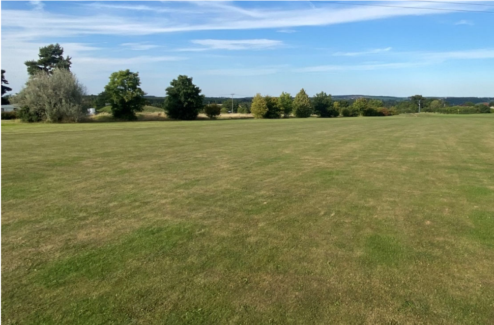
Abb. 7: Bahn 1 – Aus-Grenze Richtung Grün/zukünftiges Wohngebiet