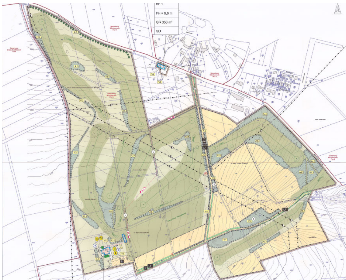
Abb. 2: Ausschnitt Planzeichnung VBB-MR 09 „Golfplatz, Teilabschnitt Nord“ – OT Münchenroda

Eine Umsetzung der naheliegenden Investitionsvorhaben, im Einzelnen die Errichtung eines Klubhauses mit den erforderlichen Pkw-Stellplätzen sowie die planerische Sicherung von bereits angesiedelten Verwaltungs- und Technikfunktionen, erforderte im Vorfeld die Aufstellung eines vorhabenbezogenen Bebauungsplan. Mit Beschluss vom 17.09.2020 wurde die Satzung über den vorhabenbezogenen Bebauungsplan VBB-Mr 09 "Golfplatz, Teilabschnitt Nord" gefasst. Der Geltungsbereich beinhaltet das Areal der bestehenden 9-Loch-Golfanlage nebst der Fläche des Betriebshofes an der Münchenrodaer Straße.