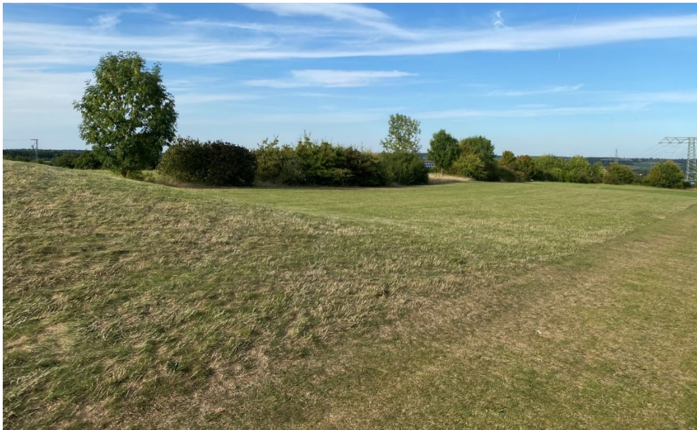
Abb. 9: Bahn 4 – Aus-Grenze Richtung zukünftiges Wohngebiet

Auf Grund des Bahnverlaufes und der daraus bestehenden Anforderungen besteht durch den Abschlag an der Bahn 4 wenig Gefährdungspotential. Die Ausrichtung der Abschläge erfolgt nach Osten mit Landungsziel etwa 100 m von der Wohnbebauung entfernt. Fehlschläge oder verirrte Bälle werden wegen der östlichen Orientierung die Distanz bis zur Wohnbebauung nicht überwinden können. Ebenso ist die Grenze des Golfplatzes in Richtung Wohnbebauung abseits der Spielbahn mit hohem Gras und partiell hohem Buschwerk (Rough) bewachsen (siehe Abb. 9). Verirrte Bälle gehen hier überwiegend schon vor der Aus-Grenze verloren.