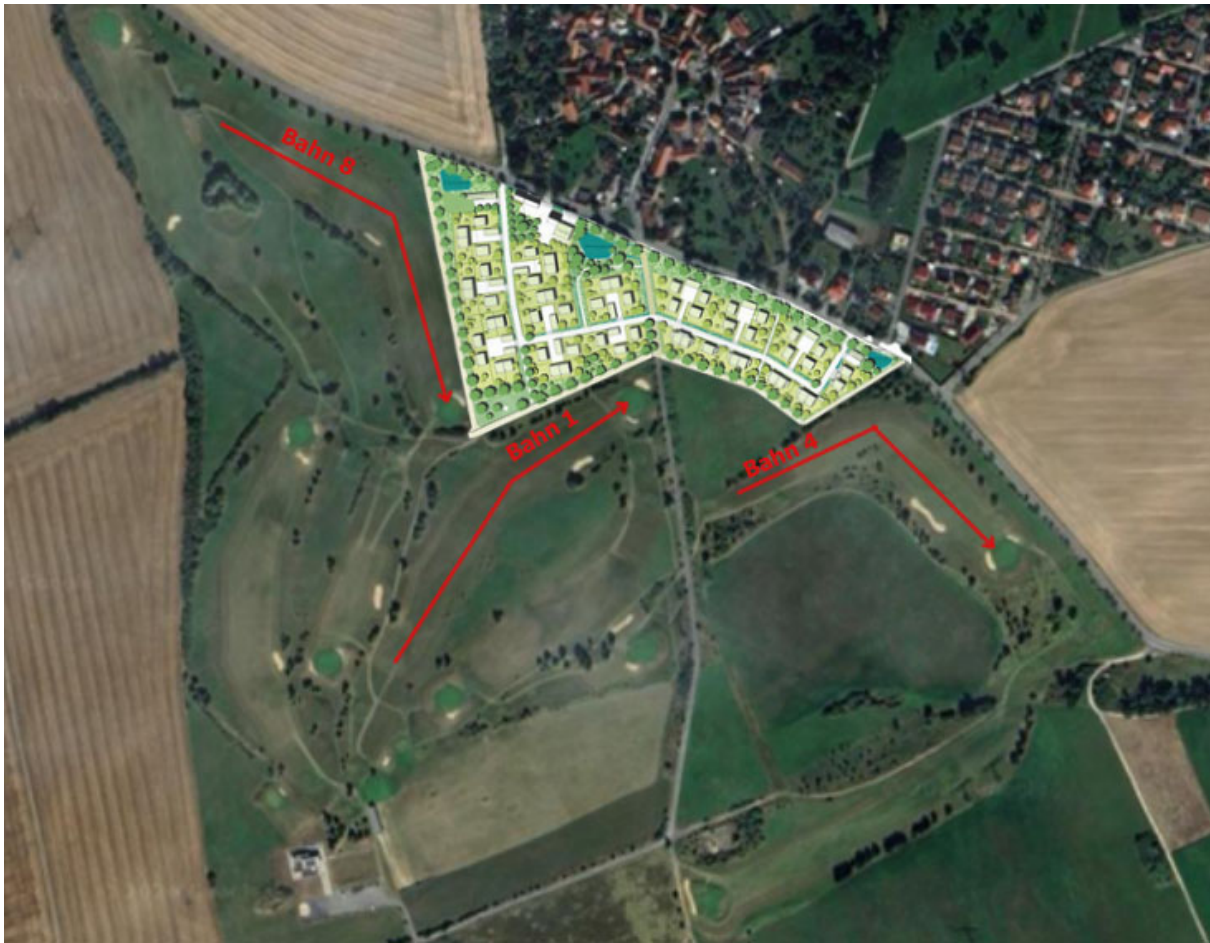
Abb. 3: Lageplan Spielbahnen 8, 1, 4 mit geplantem Wohngebiet