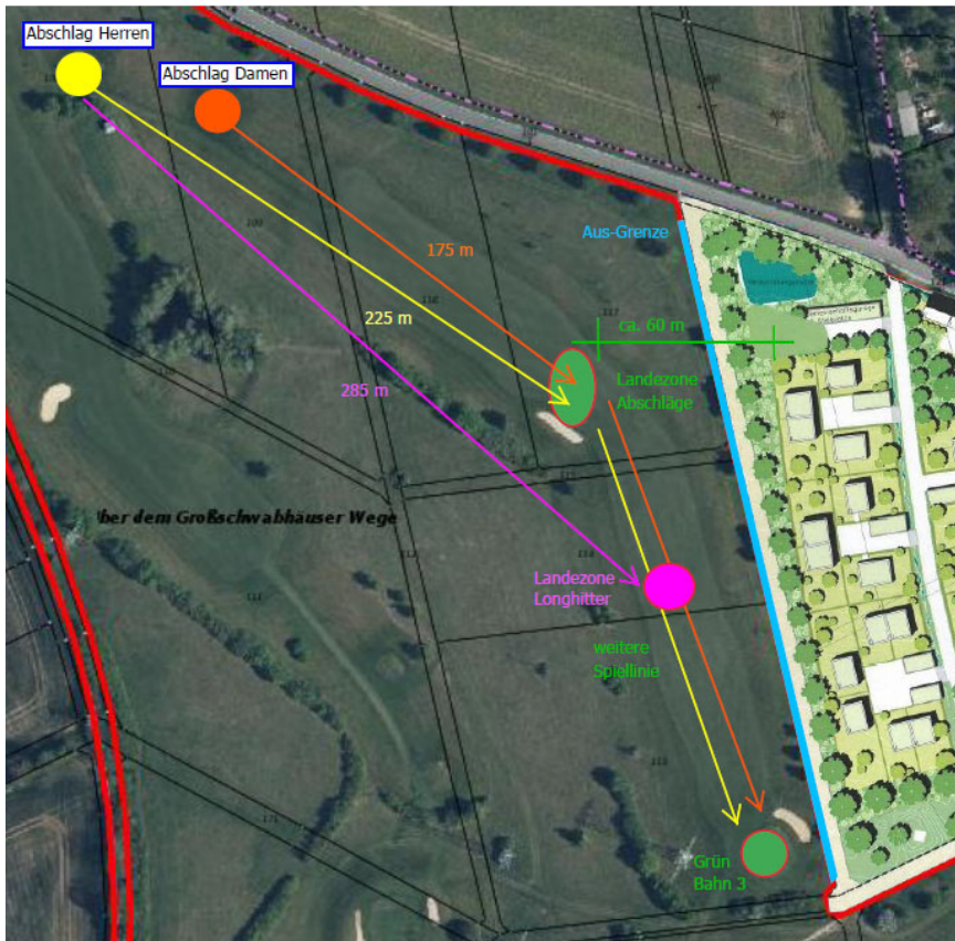
Abb. 4: Lageplan Bahn 8

Spieltechnisch ist die Bahn 8 mit 412 m Länge vom Herrenabschlag bzw. 363 m Länge vom Damenabschlag, ist als „Par 4“, d. h. mit vier Schlägen vom Abschlag bis ins Loch, angelegt. Das Grün soll in der Regel mit zwei Schlägen erreicht werden, was hier auf Grund der Länge der Bahn nur den wenigsten Amateuren gelingt. Wird die durchschnittliche Länge des Abschlags eines Amateurgolfers (bei den Herren 180 – 230 m/ Mittel 210 m; bei den Damen 120 – 185 m/ Mittel 150 m) herangezogen, landen die geschlagenen Bälle, sowohl Damen als auch Herren, in etwa auf der Höhe des „Bunkers“, kurz bevor die Spielbahn eine Richtungsänderung nach Süden beginnt (siehe Landezone Abschläge).