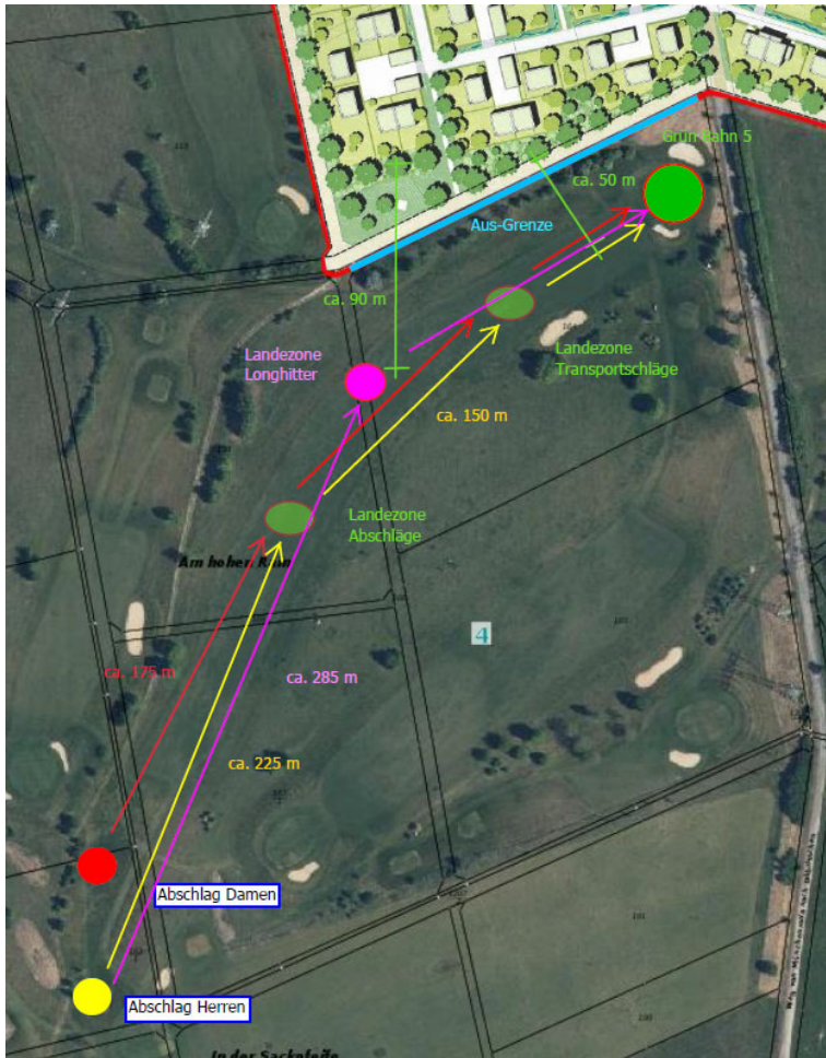
Abb. 6: Lageplan Bahn 1

Die Bahn 1 mit 447 m Länge vom Herrenabschlag bzw. 394 m Länge vom Damenabschlag, ist als „Par 5“, d. h. mit fünf Schlägen vom Abschlag bis ins Loch, angelegt. Das Grün soll in der Regel mit drei Schlägen erreicht werden, was hier im Gegensatz zur Bahn 8 deutlich mehr Amateuren gelingt.