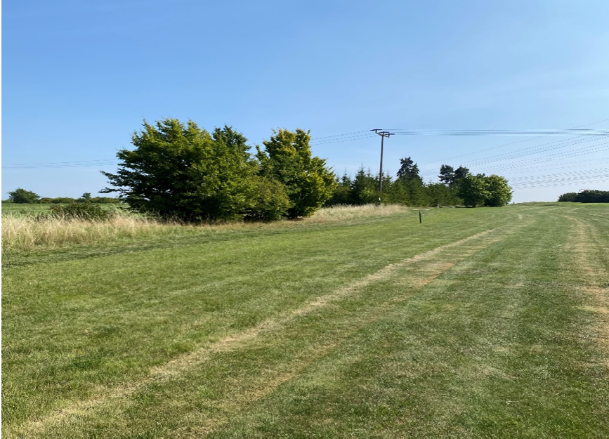
Abb. 5: Bahn 8 – Aus-Grenze Richtung Grün/zukünftiges Wohngebiet

der Wohnbebauung geschlagen werden, ca. 60 m (oder kürzer) vor der angedachten Baugrenze landen. Zudem ist die Grenze des Golfplatzes in Richtung Wohnbebauung abseits der Spielbahn mit hohem Gras und partiell hohem Buschwerk (Rough) bewachsen (siehe Abb.5). Eventuell zu lang geschlagene oder verirrte Bälle gehen hier überwiegend schon vor der Aus-Grenze verloren.